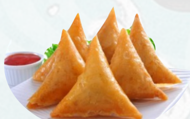
2. SAMOSA 3 PZ Ripieni di verdure e curry €2,50