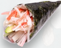
T6. CALIFORNIA Surimi, cetriolo, mayo €3,60