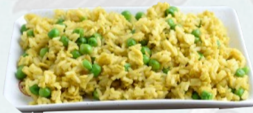
108A. RISO AL CURRY Uovo e piselli €4,50