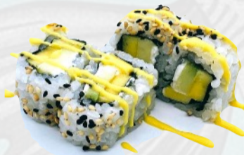
U29. CRUNCHY ONION Surimi, cetriolo, flakes di cipolla croccante, teriyaki, spicy mayo €5,50