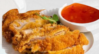
208. CRISPY THAI CHICKEN €6,00