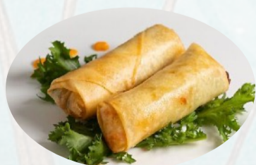
1. INVOLTINI 2PZ Ripieni di verdure, curry €2,50