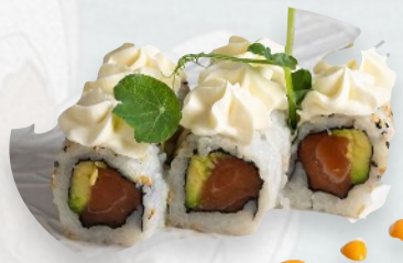
U2. SAKE PHILADELPHIA Salmone, avocado philadelphia €5,00