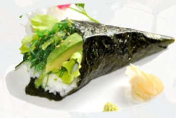
T7. YASAI Cetriolo, wakame, avocado, mayo €3,50