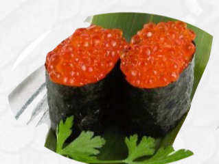
G4. IKURA 2PZ €4,00