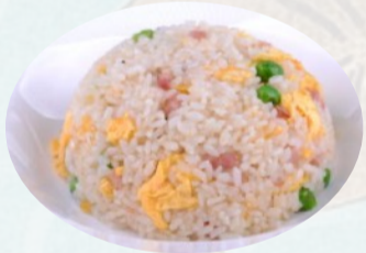
110. RISO ALLA CANTONESE Prosciutto cotto, piselli, uovo €4,50