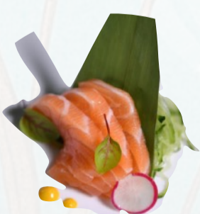
S1. SALMONE SASHIMI 3 PZ €3,00