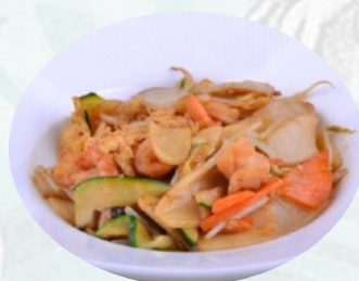
118. GNOCCHI DI RISO MARE verdure, uovo €6,00