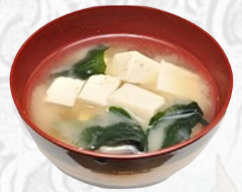
Z3. ZUPPA DI MISO Brodo di Miso, tofu, alga €3,50