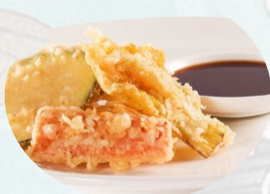
223. YASAI TEMPURA Verdure in tempura €5,50