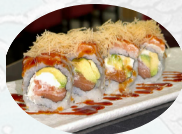
U12. SMOKING Salmone, avocado, philadelphia, salmone scottato, kataifi, teriyaki €5,50