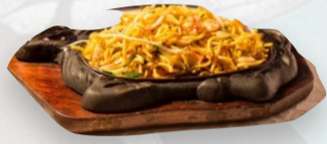
106. SPAGHETTI ALLA PIASTRA MARE €7,00