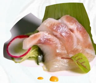
S3. BRANZINO SASHIMI 3 PZ €3,00