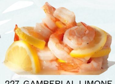
227. GAMBERI AL LIMONE €7,00