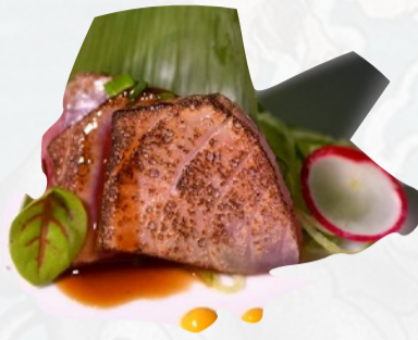
S6. MAGURO FLAMBE Tonno scottato, teriyaki, sesamo 3 PZ €4,00