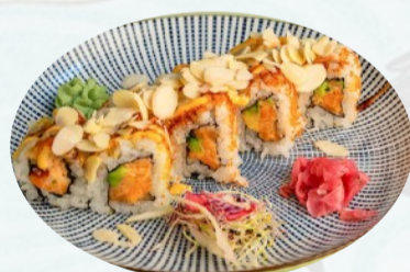
U14. SALMON GUSTOSO Salmone, avocado, mandorle tostate, teriyaki €5,50