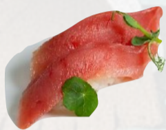
N2. MAGURO Tonno €3,00