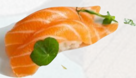
N1. SAKE Salmone €3,00