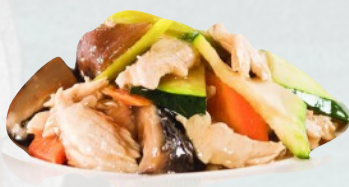
200. POLLO CON VERDURE €6,00