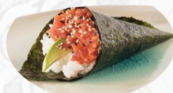
T4. SPICY TUNA Tonno piccante avocado €3,60