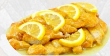
203. POLLO AL LIMONE FRITTO €6,00