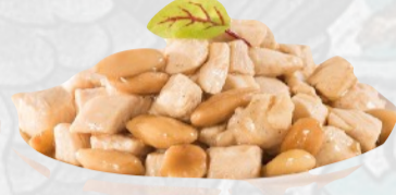
206. POLLO ALLE MANDORLE €6,00