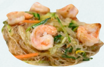
107B. SPAGHETTI DI SOIA GAMBERI €5,50