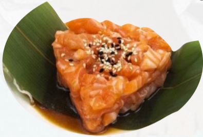
S7. SAKE TARTARE Salmone, sesamo, salsa ponzu €6,00