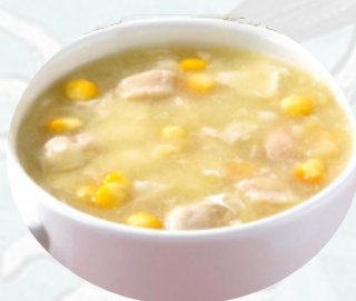
Z2. ZUPPA DI MAIS CON POLLO Brodo, mais, pollo, uovo €3,50