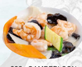
228. GAMBERI CON VERDURE €7,00