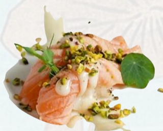
N9. SAKE PISTACCHIO Salmone scottato, mayo al latte, granella di pistacchio €3,50