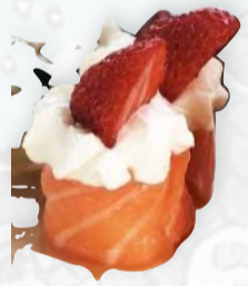
G11. BIGNE FRAGOLA 2 PZ Salmone, philadelphia, fragola €4,00