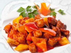
213. MAIALE IN AGRODOLCE fritto €6,00