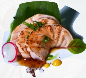
S5. SAKE FLAMBE Salmone scottato, teriyaki, sesamo 3 PZ €4,00