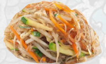
107A. SPAGHETTI DI SOIA VERDURE €5,00