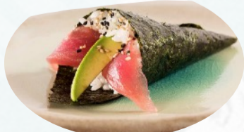
T2. MAGURO Tonno avocado €3,60