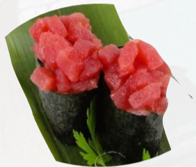
G2. SPICY TUNA 2 PZ Tonno tartare, spicy mayo €4,00