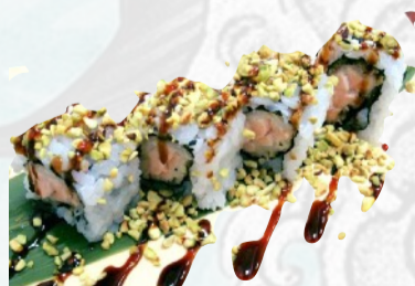
U19. PISTACCHIO Salmone impanato, pistacchio, teriyaki, salsa secret €5,50