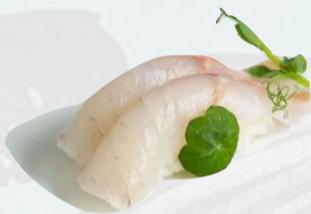
N3. SUZUKI Branzino €3,00