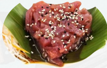
S8. MAGURO TARTARE Tonno, sesamo, salsa ponzu €6,00