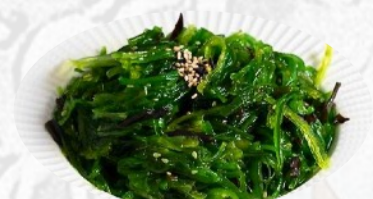
4. GOMA WAKAME Alghe giapponesi marinate, sesamo €3,50