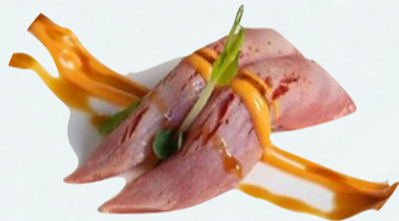
N6. TONNO SCOTTATO Tonno scottato alla fiamma, teriyaki, spicy mayo €3,50