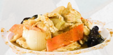
199. POLLO AL CURRY €6,00