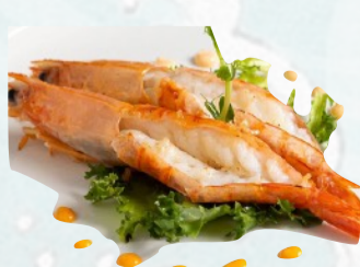
231. GAMBERONI ALLA GRIGLIA €7,00