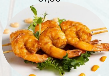
230. SPIEDINI GAMBERI €7,00