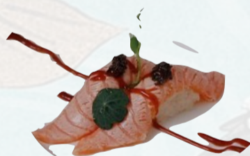
N12. TONNO TRUFFLE Tonno scottato, crema di tartufo, teriyaki €3,50