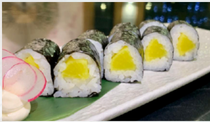
H13. SHINKO 4 pz Rapa gialla marinata