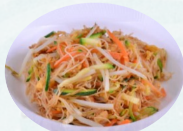
114. SPAGHETTI DI RISO VERDURE, uovo €6,00