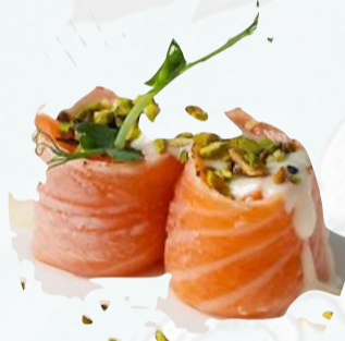
G7. BIGNE PISTACCHIO Salmone scottato, mayo al latte, granella pistacchio €4,00