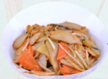
117. GNOCCHI DI RISO VERDURE, uovo €5,50