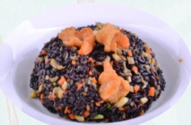
113. RISO VENERE Riso Venere, gamberi, mais, uovo, surimi €6,00