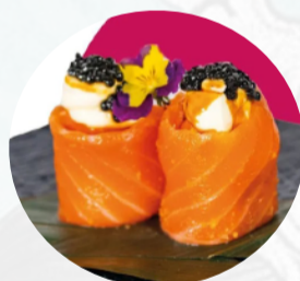
G10. BIGNE TARTUFO 2 pz Salmone, philadelphia, crema di tartufo €4,00