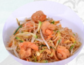
115. SPAGHETTI DI RISO MARE, uovo €6,50