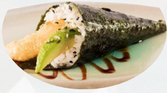
T5. EBITEN Gambero in tempura avocado, teriyaki €3,60