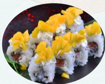
U13. MANGO Salmone, avocado, mango, philadelphia €5,50