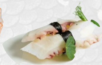
N11. TAKO Polpo cotto al vapore €3,00