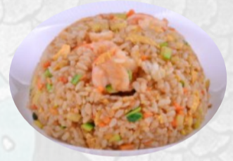
109. RISO MARE Riso saltato frutti di mare, uovo €5,50