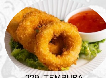
229. TEMPURA CALAMARI €7,00