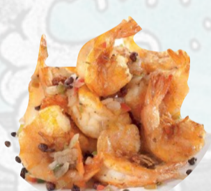
224. GAMBERI GRIGLIATI SALE E PEPE €7,00