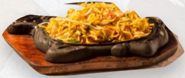
105. SPAGHETTI ALLA PIASTRA CARNE €6,50