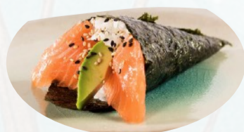
T1. SAKE Salmone avocado €3,60