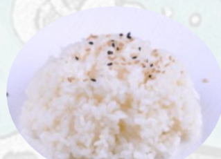
111. RISO BIANCO AL VAPORE €2,00