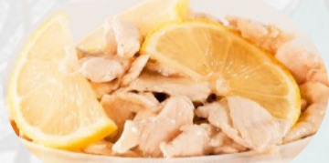
204. POLLO AL LIMONE NON FRITTO €6,00