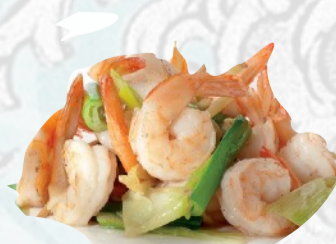
232. GAMBERI CON PORRI €7,00