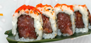
U4. SPICY TUNA Tonno, avocado, spicy maio, sesamo €5,00