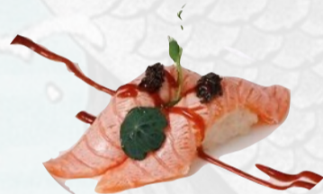
N8. SAKE TRUFFLE Salmone scottato, crema di tartufo, teriyaki €3,50