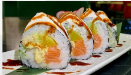
H14. FUJI ROLL 4 pz Salmone, surimi, rapa gialla giapponese, avocado, philadelphia, teriyaki