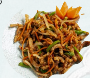
212. MANZO PICCANTE CROCCANTE €6,00