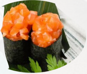
G1. SPICY SALMON 2 PZ Salmone tartare, spicy mayo €4,00