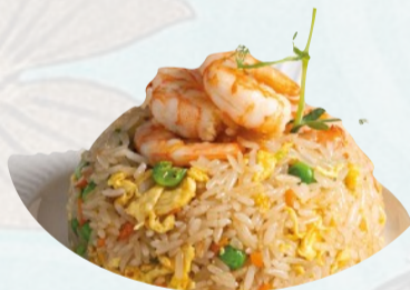
110A. EBI MESHİ Riso saltato con gamberi, piselli, uovo €5,50