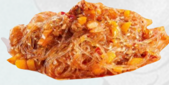
107. SPAGHETTI DI SOIA PICCANTI CARNE €5,00