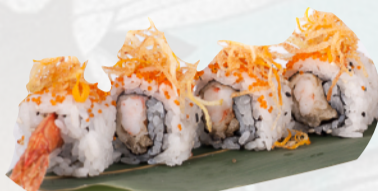
U6. EBITEN Gambero in tempura, kataifi, teriyaki €5,50