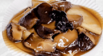
209. MANZO FUNGHI E BAMBU €6,00