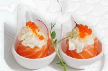
G8. BIGNE PHILA 2 PZ Salmone, philadelphia €4,00