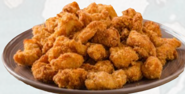
201. POLLO FRITTO €6,00