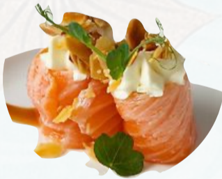
G9. BIGNE MANDORLA 2 PZ Salmone, Philadelphia, mandorle €4,00