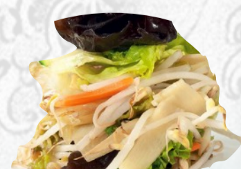
235. VERDURE MISTE SALTATE €4,00