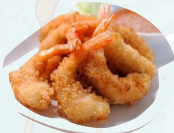
226. GAMBERI FRITTI €7,00