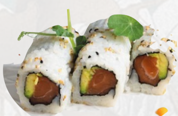
U1. SAKE AVOCADO Salmone e avocado €5,00