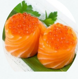
G6. BIGNE IKURA 2 PZ Salmone, Ikura €4,00