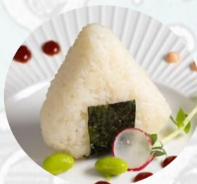
N10. ONIGIRI MIURA Polpetta di riso con cuore di salmone grigliato, teriyaki, sesamo €3,00