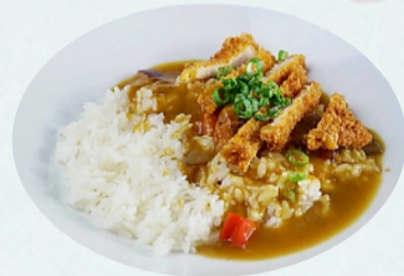
108. CHICKEN CURRY RICE €6,00