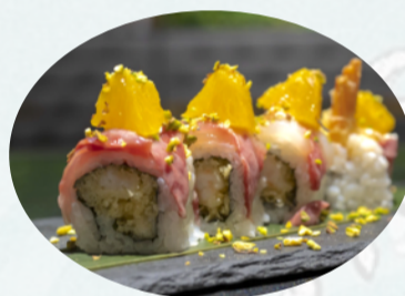
U11. SICILIAN ROLL Gambero in tempura dentro, branzino scottato, arancia, pistacchio, philadelphia sopra €5,50