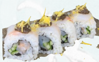
U18. TRUFFLE Branzino, cetrioli, crema di tartufo €5,00