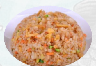
112. RISO VERDURE uovo €4,50