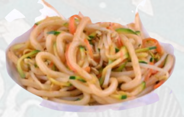
104. UDON VERDURE Spaghetti di grano tenero con verdure, uovo €7,00