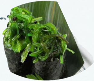
G5. WAKAME 2 PZ €3,90