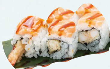
U9. TIGER Gambero in tempura dentro, salmone sopra, teriyaki, mayo €5,50