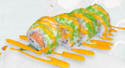
U3. KAMIKAKZE Salmone piccante, avocado, spicy mayo €5,50