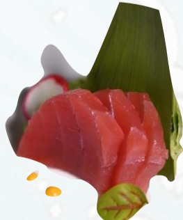
S2. TONNO SASHIMI 3 PZ €3,00