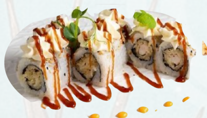
U17. EBI PISTACCHIO Gambero in tempura, philadelphia, granella pistacchio, teriyaki €5,50