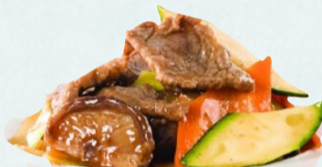
211. MANZO SALTATO CON VERDURE €6,00