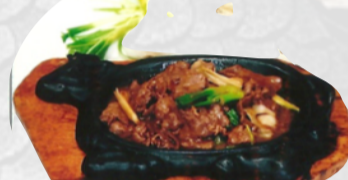
210. MANZO CON PORRI €6,00