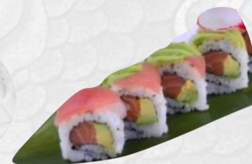
U8. RAINBOW Surimi, avocado, cetriolo dentro, ricoperto con pesce misto sopra €5,50