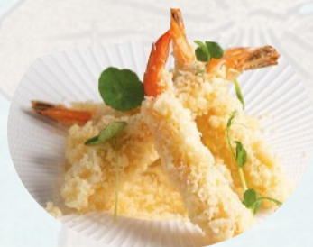
221. EBI TEMPURA 4PZ Gamberi in tempura €7,00