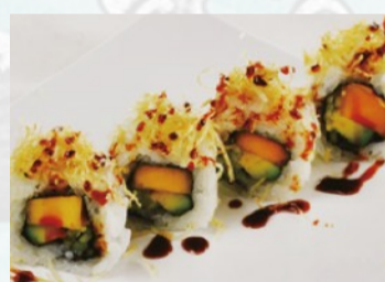
U15. VEGGIE ROLL Patata dolce fritta, avocado, flakes di cipolla croccante, mayo €5,50