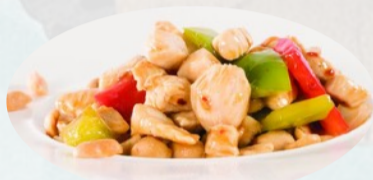
207. POLLO KUNGPAO PICCANTE, arachidi €6,00