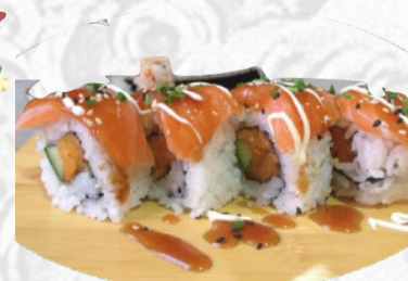
U20. PERFECT MATCH Patata dolce fritta, avocado, surimi, salmone sopra, Mayo, teriyaki €5,50