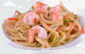
103. UDON MARE Spaghetti di grano tenero con frutti di mare, uovo €7,50