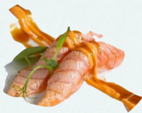
N5. SAKE SCOTTATO Salmone scottato, teriyaki, spicy mayo €3,50