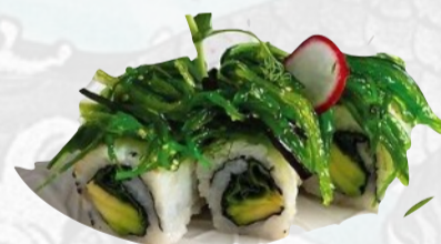
U16. FRESH Salmone, avocado, goma wakame, maionese €5,50