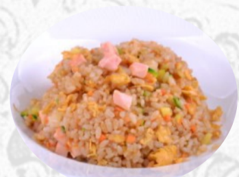
116. RISO CON SALMONE E VERDURE, uovo €6,00