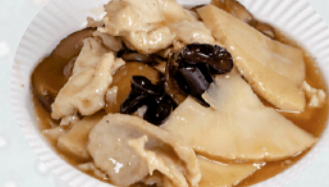
202. POLLO FUNGHI E BAMBU €6,00