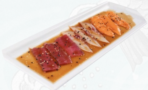
CARPACCIO MISTO 6 pz fettine sottili di salmone, tonno, branzino, gambero in salsa ponzu e sesamo €5,00