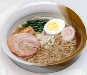
101. RAMEN CARNE Spaghetti in brodo di maiale, uovo sodo, verdure, surimi €5,50