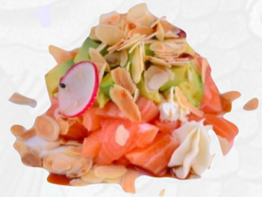
S9. MAME TARTARE Salmone, avocado, philadelphia, mandorle, salsa ponzu, teriyaki €6,50