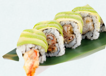
U10. DRAGON Gambero in tempura, avocado, mayo, teriyaki €5,50