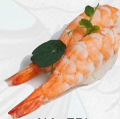
N4. EBI Gambero cotto al vapore €3,00