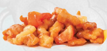
205. POLLO IN AGRODOLCE €6,00