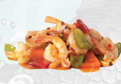
225. GAMBERI IN SALSA CHILI PICCANTI €7,00