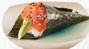
T3. SPICY SALMON Salmone piccante avocado €3,60