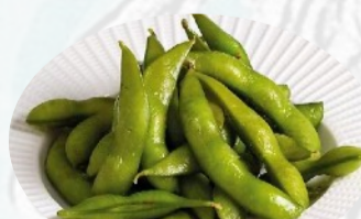
3. EDAMAME Fagioli di soia freschi €3,50