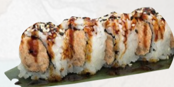
U5. MIURA Salmone grigliato, Philadelphia, teriyaki, sesamo €5,00