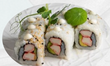
U7. CALIFORNIA Surimi, avocado, cetriolo, mayo €5,00