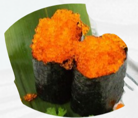
G3. TOBIKO 2 PZ €4,00