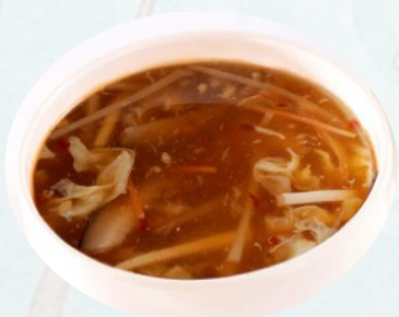
Z1. ZUPPA PECHINESE AGROPICCANTE Brodo, pollo, uova, soia €3,50