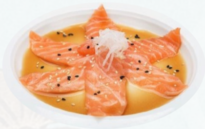
CARPACCIO SALMONE 6 pz fettine salmone taglio carpaccio in salsa ponzu e sesamo €5,00