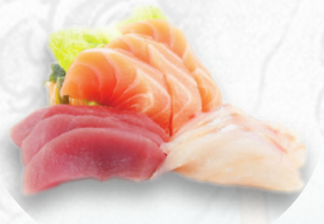
S4. SASHIMI MISTO 6 PZ €5,50