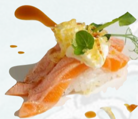
N7. SAKE PHILA Salmone scottato alla fiamma, philadelphia, teriyaki €3,50